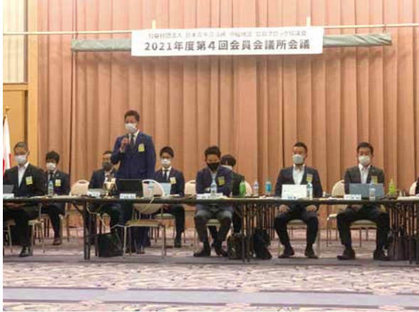
第4回会員会議所会議 (広島)